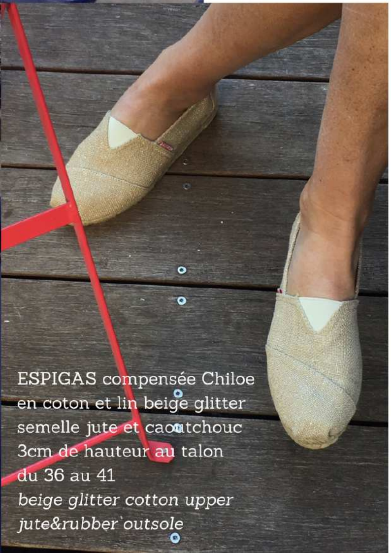
ESPIGAS compensée Chiloe en coton et lin beige glitter semelle jute et caoutchouc 3cm de hauteur au talon du 36 au 41 beige glitter cotton upper jute&rubber outsole