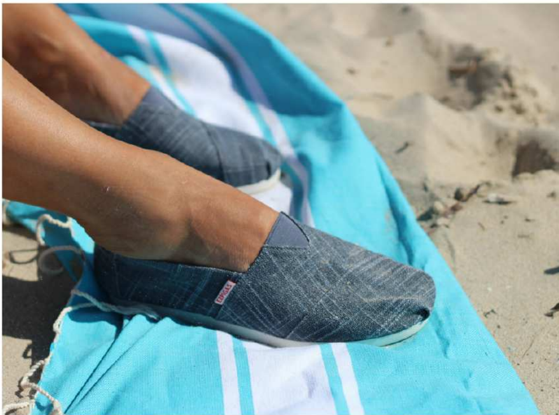
ESPIGAS Mendoza toile coton chambray bleu semelle en caoutchouc du 36 au 45 chambray cotton upper rubber outsole