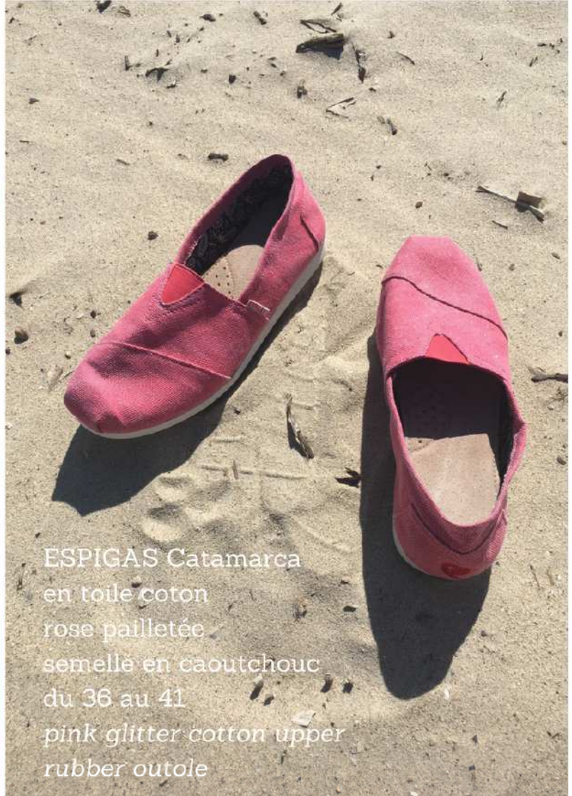
ESPIGAS Catamarca en toile coton rose pailletée semelle en caoutchouc du 36 au 41 pink glitter cotton upper rubber outsole