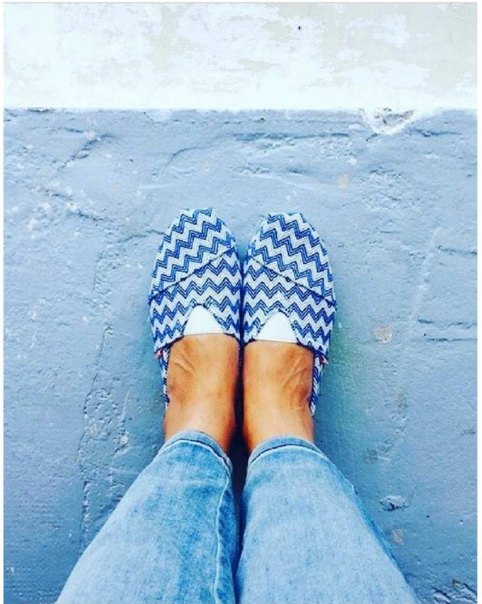
ESPIGAS Santiago en coton tissé semelle exterieure en caoutchouc du 36 au 45 Wowen cotton rubber outsole